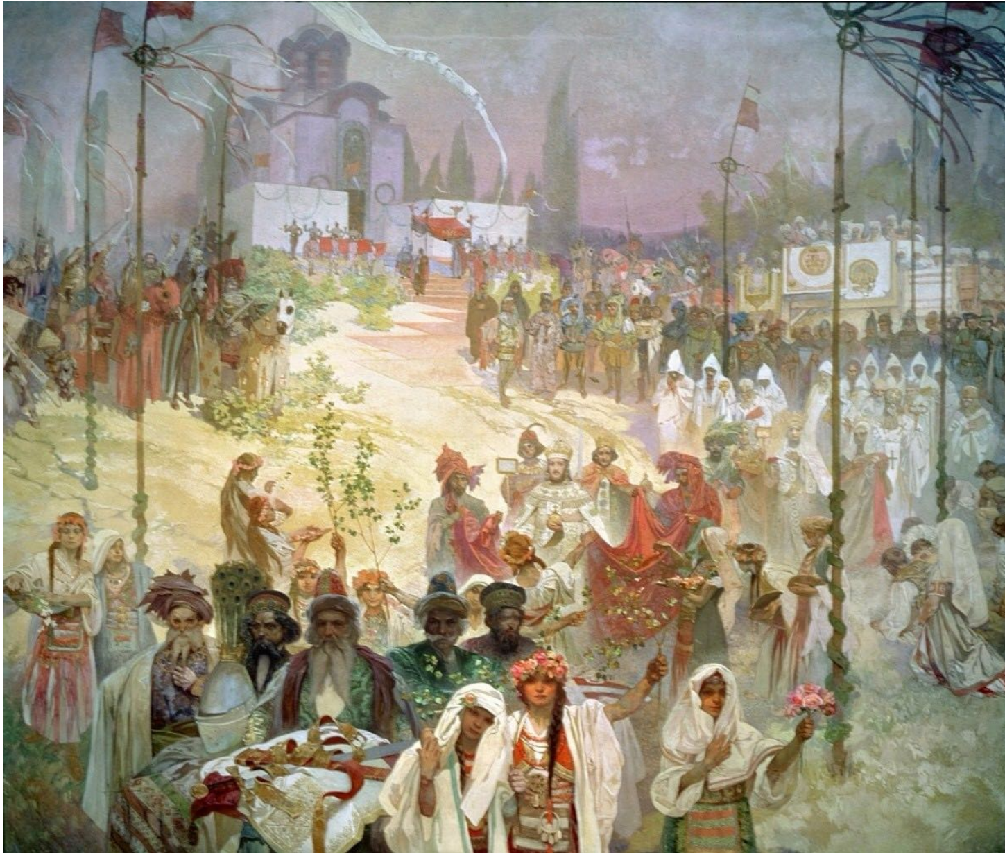
6. Couronnement du tsar serbe Stefan Dušan comme Empereur byzantin (XIV e siècle) Le code de la loi slave