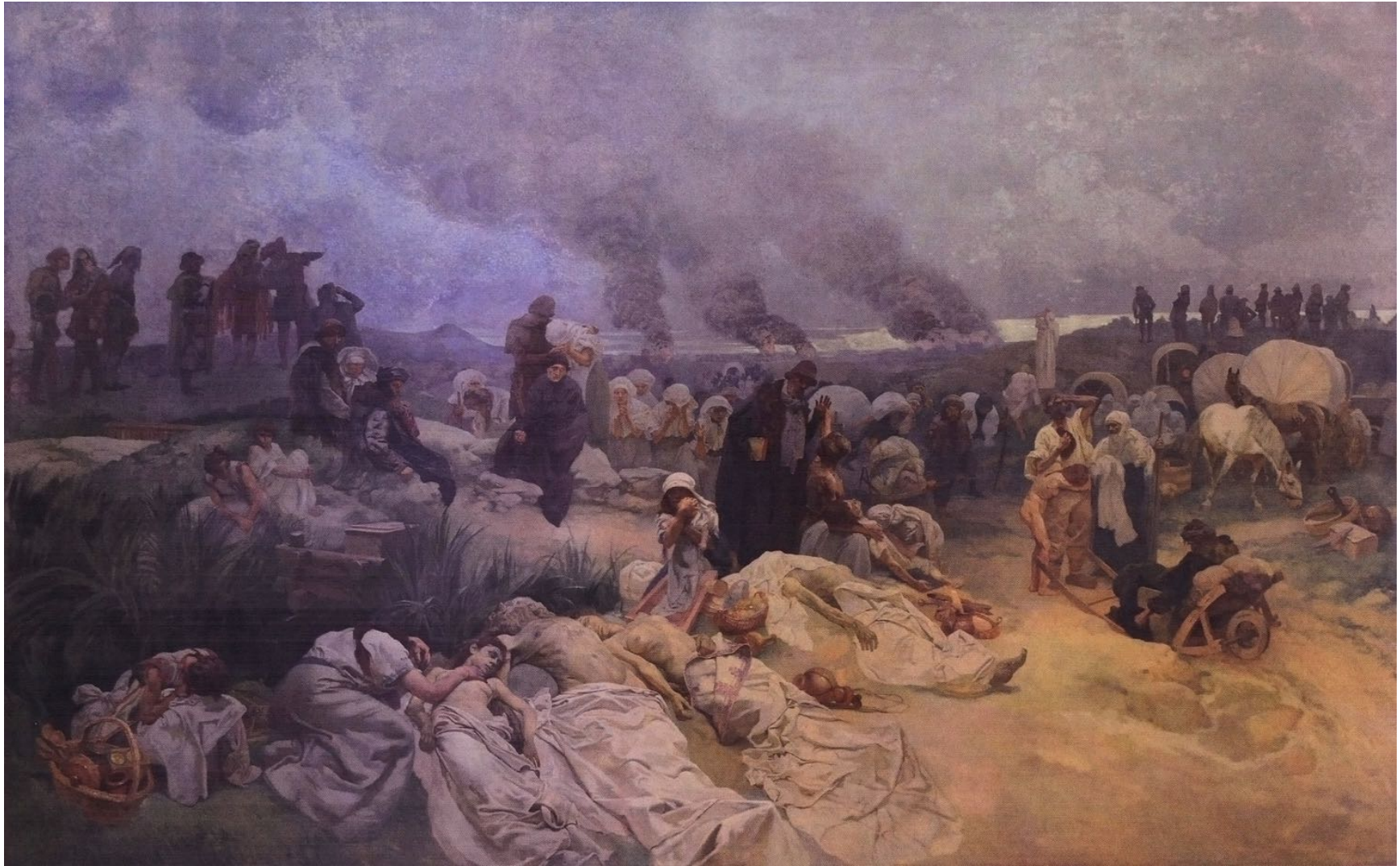
12. Petr Chelcicky à Vodnany (XV e siècle)