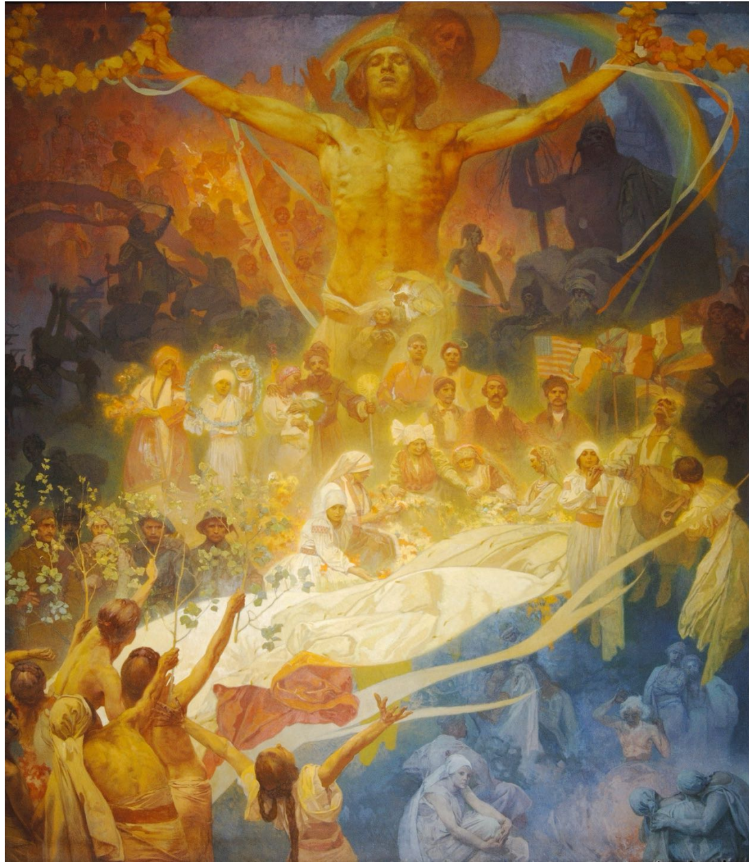
20. L'Apothéose des Slaves (XX e siècle)