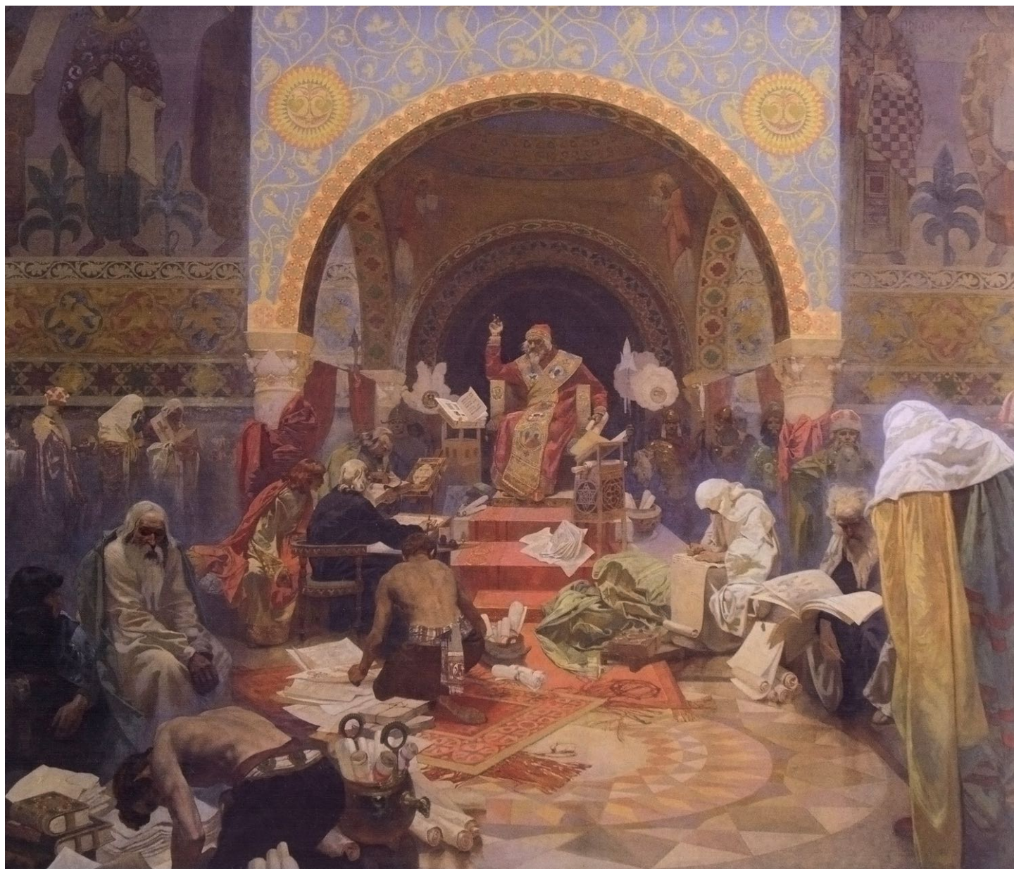
4. Siméon, tsar des Bulgares (X e siècle) Fondateur de la littérature slave