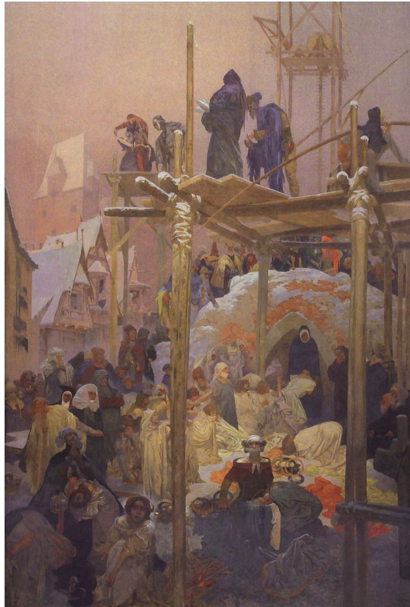
7. Jan Milíč de Kroměříž (XIV e siècle) Une maison close convertie en monastère