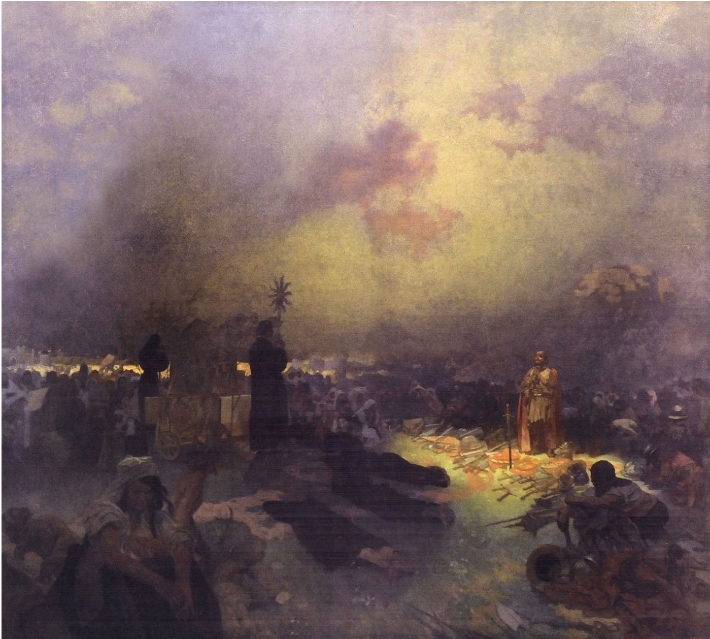
11. Après la bataille de la colline de Vitkov (XV e siècle)