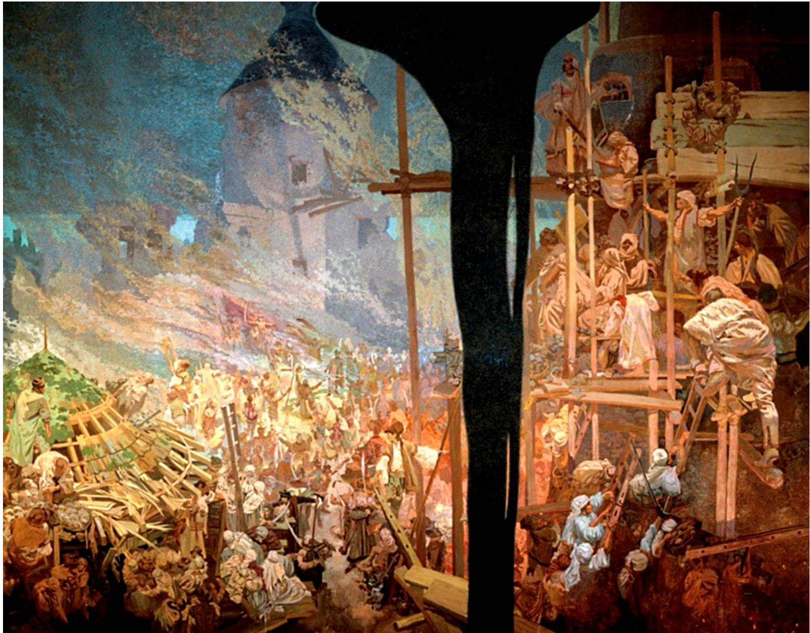
14. La Défense de Szigetvár (XVI e siècle)