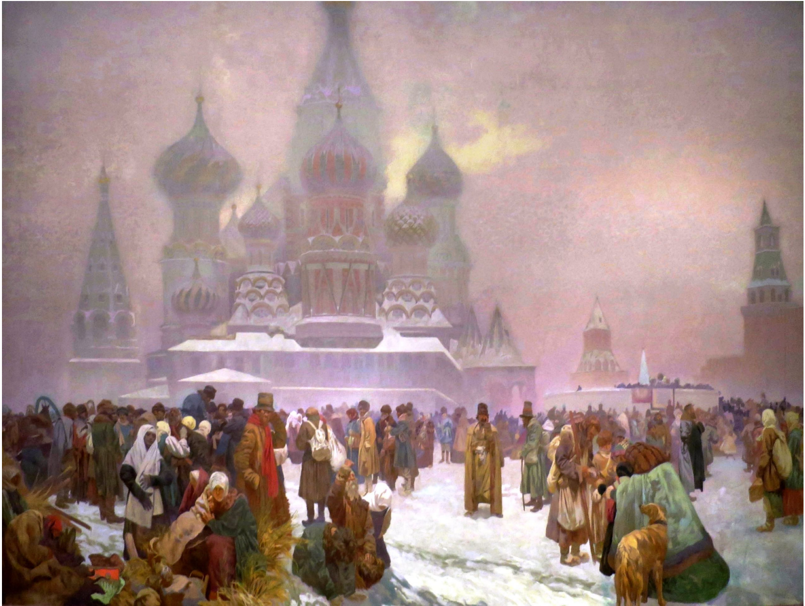
19. L'Affranchissement des paysans russes (1861) Le travail libre, base des États