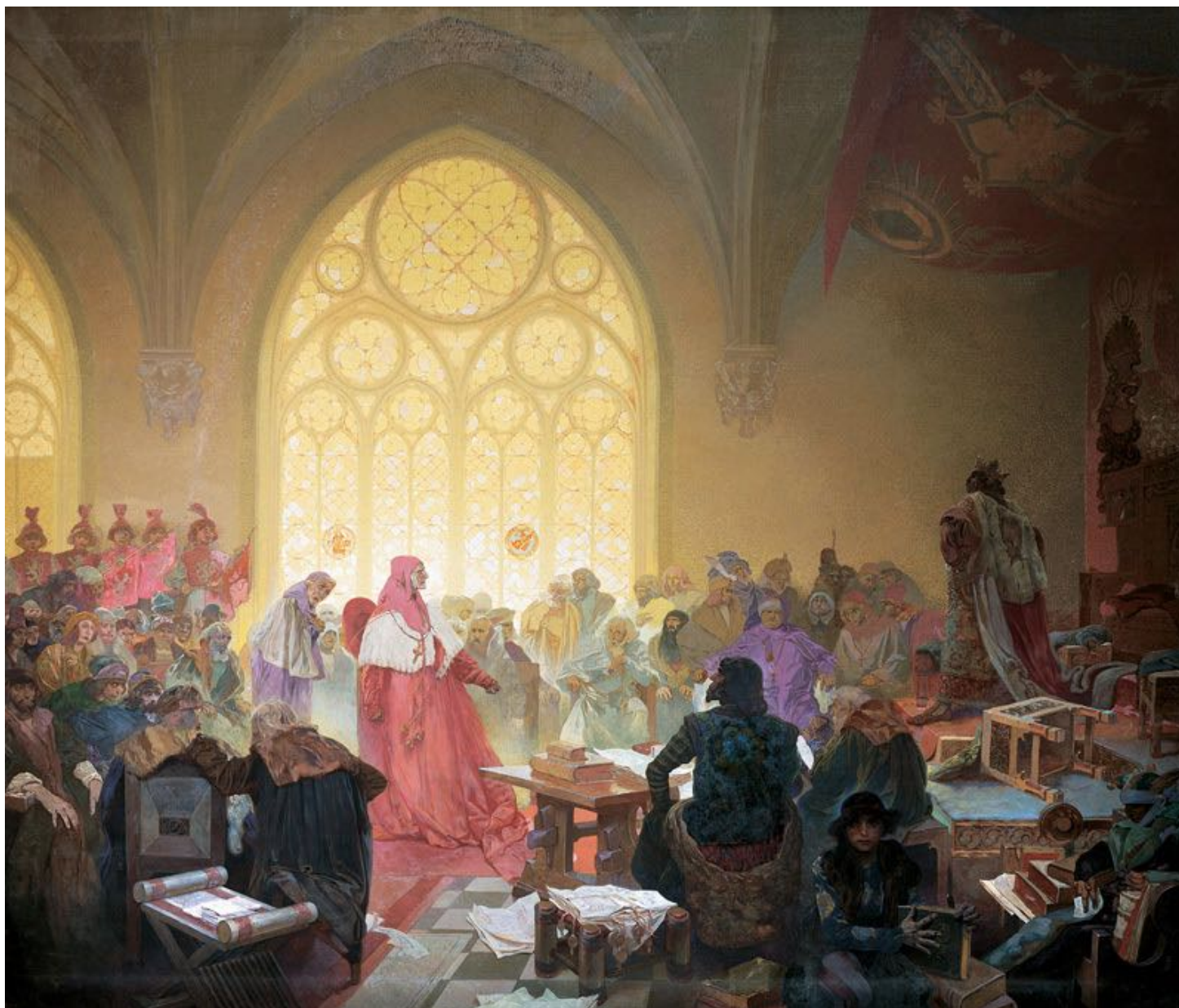
13. Le Roi hussite Jiří z Poděbrad (XV e siècle) « Pacta sunt servanda – Les pactes doivent être respectés »