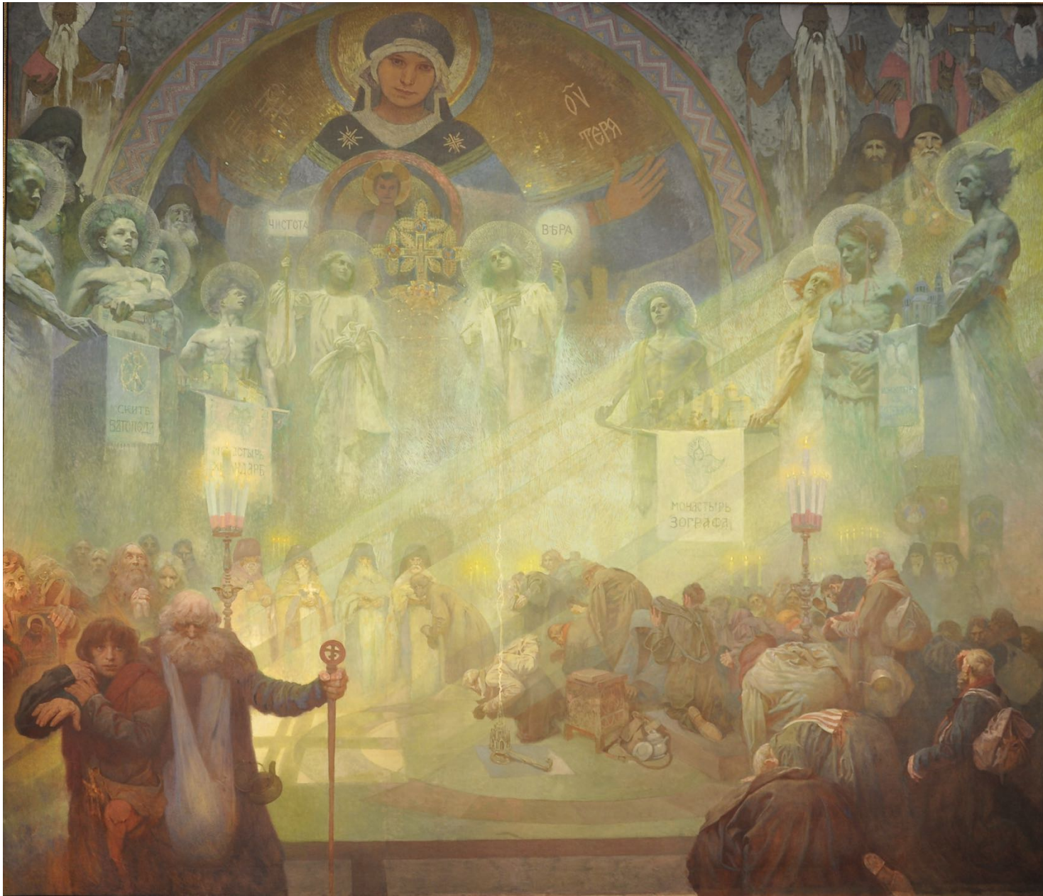
18. Mont Athos, la montagne sacrée (XIX e siècle)