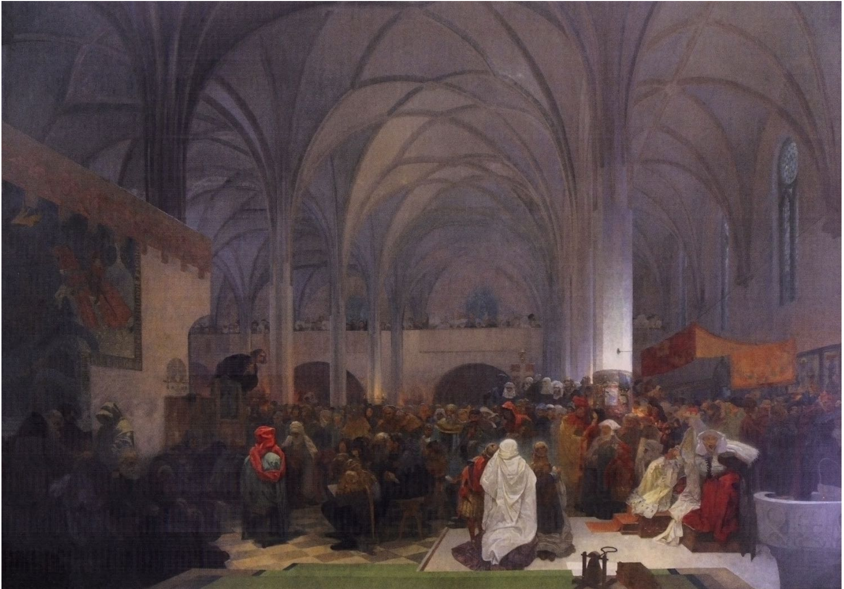
9. Prédication de maître Jan Hus dans la chapelle de Bethléem (XV e siècle) La vérité triomphe