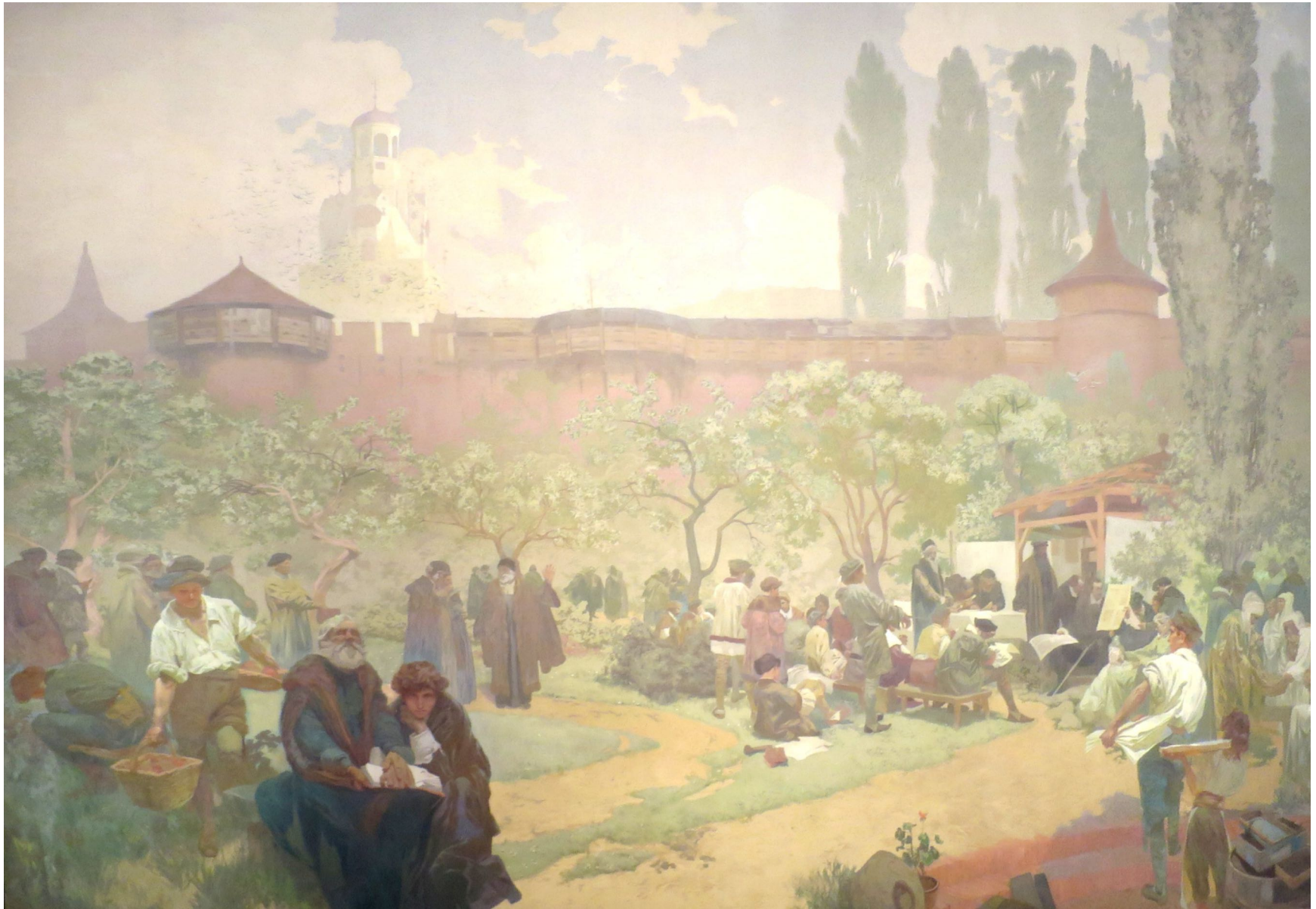
15. L'École fraternelle à Ivančice