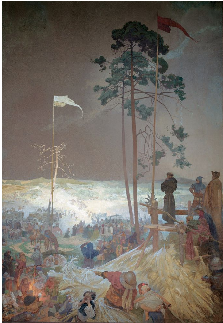
10. Entretien à Křížky (XV e siècle) Communion utraquiste