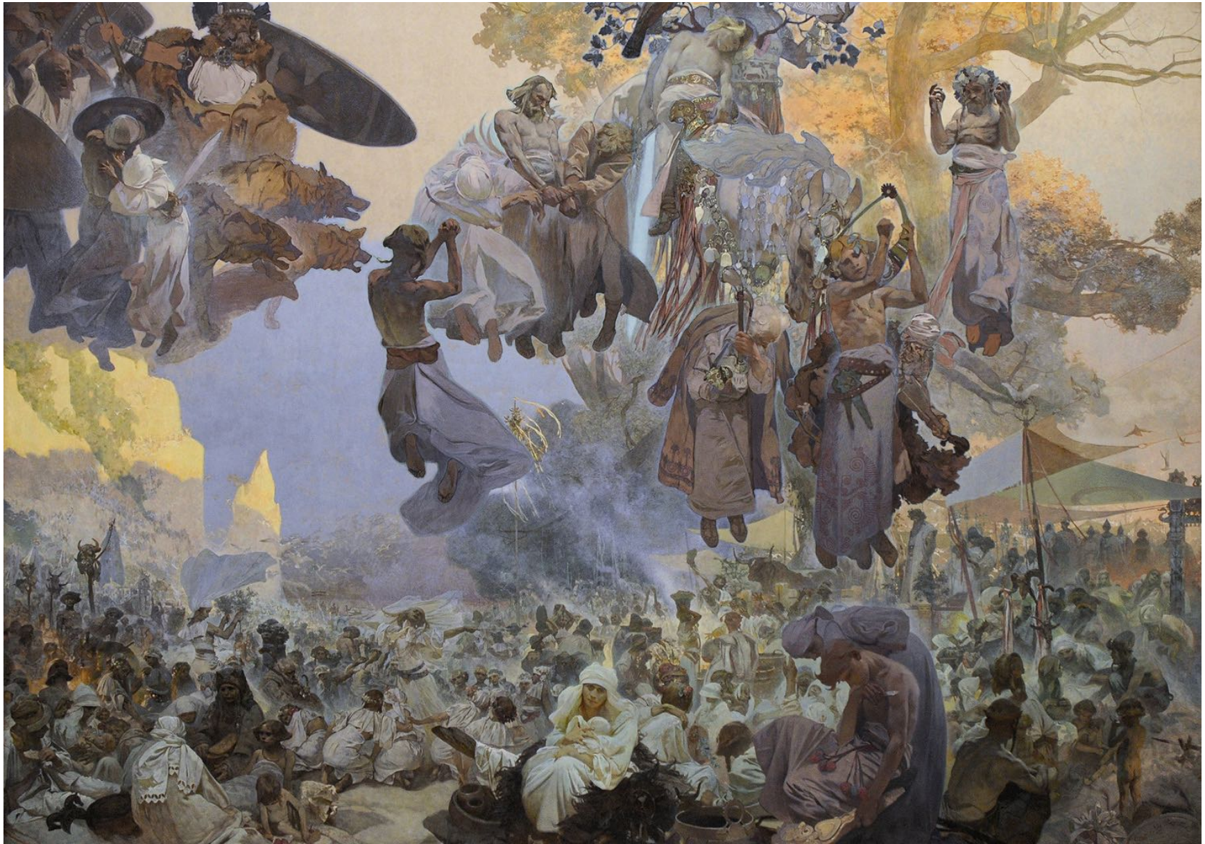
2. La Célébration de Svantovit (IX e siècle) Quand les dieux sont en guerre, le salut est dans les arts