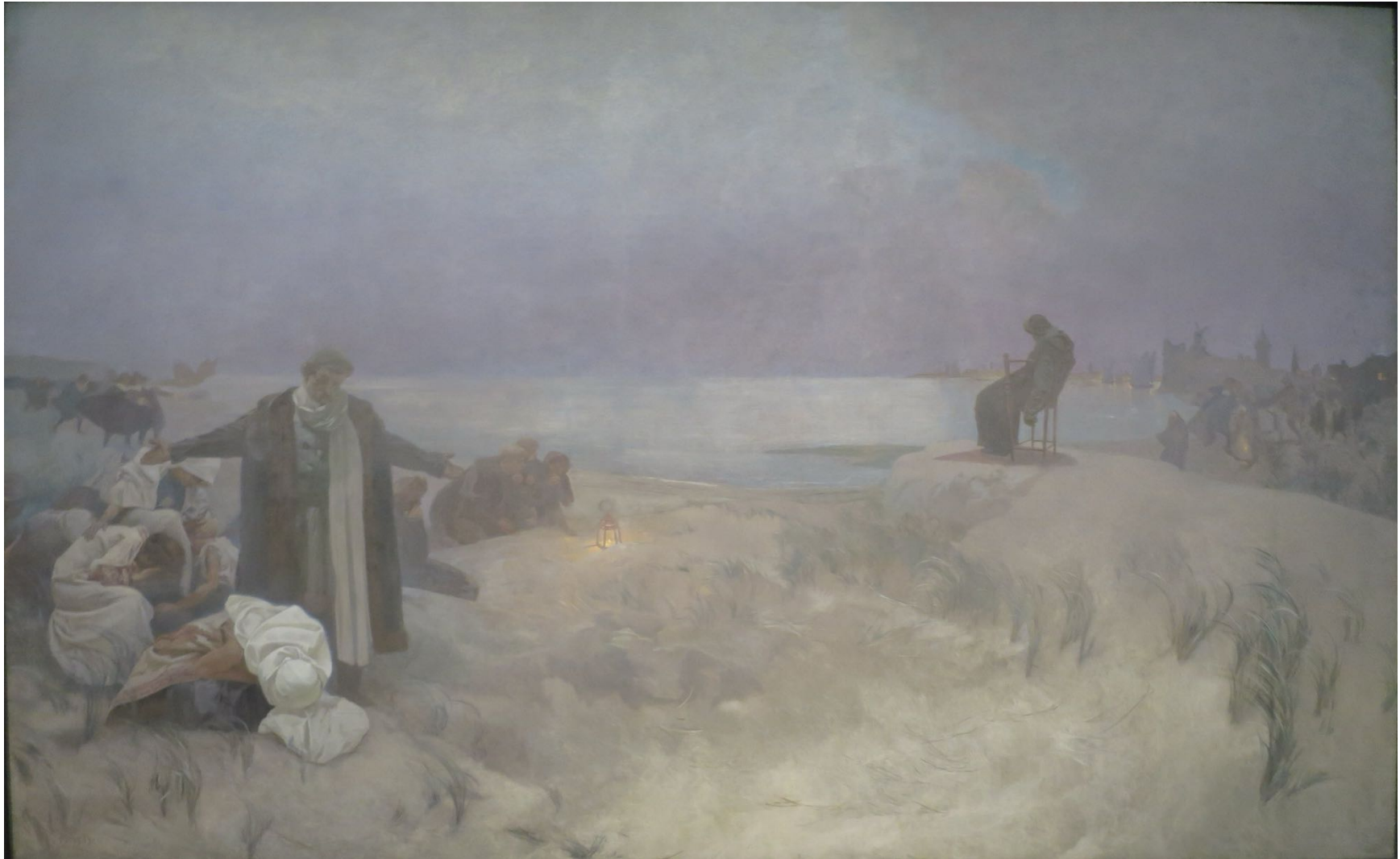
16. Le Dernier Jour de Jan Amos Komenský (XVII e siècle) Faible lueur d'espoir