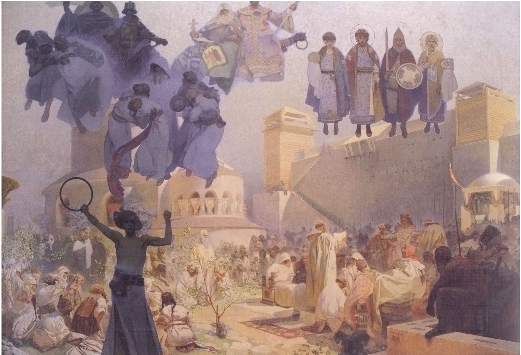
3. Introduction à la liturgie slave (IX e siècle) Rendez louange à Dieu dans votre langue maternelle