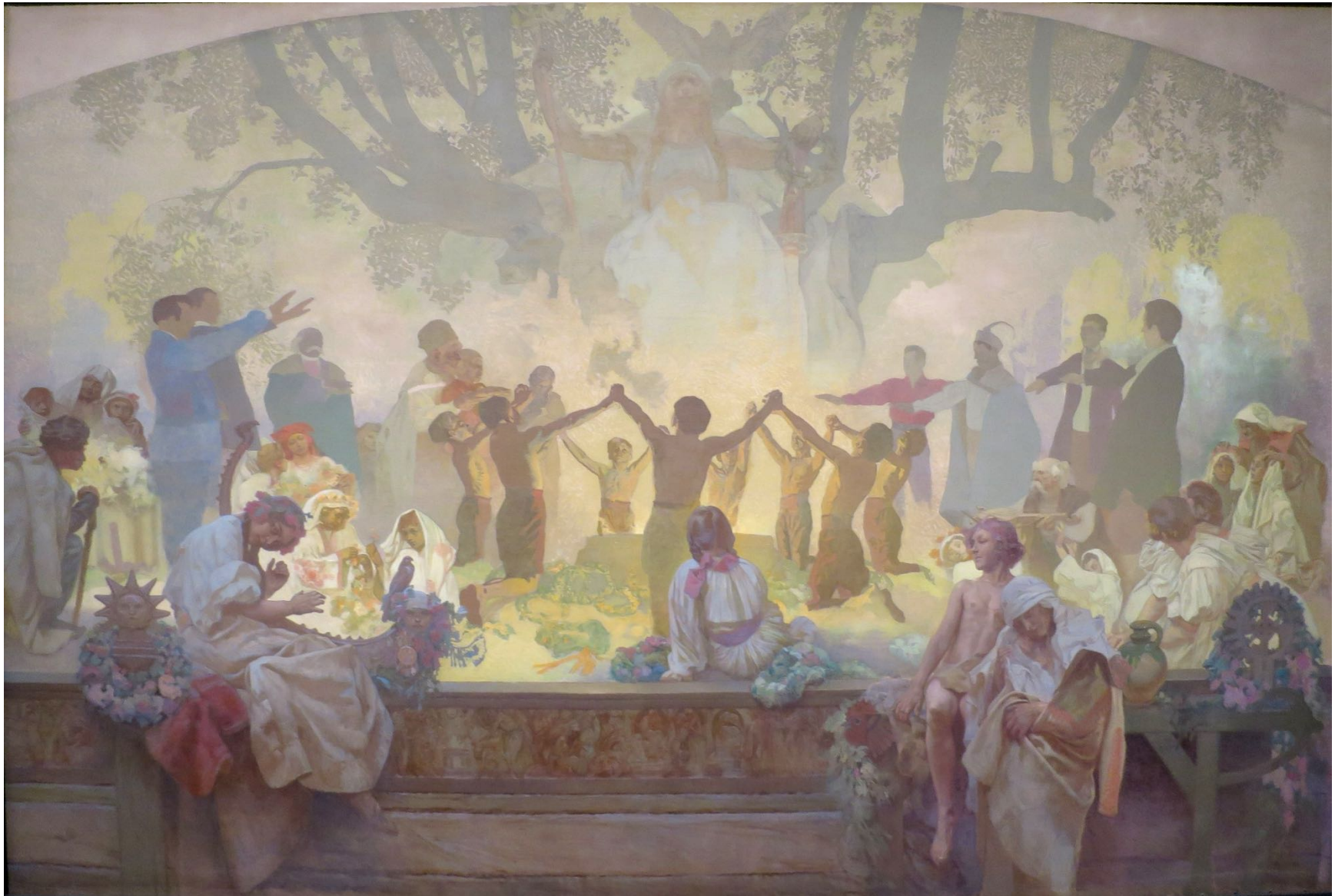
17. Le Serment d'Omladina (XIX e siècle) Le renouveau slave