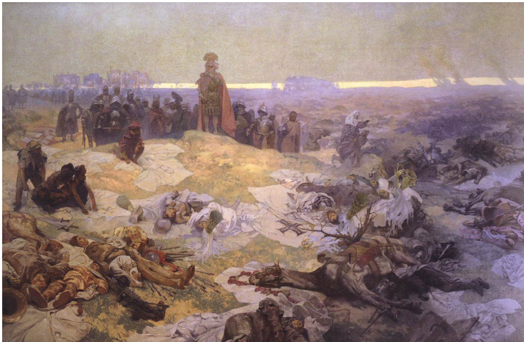
8. Après la bataille de Grunwald (XV e siècle)