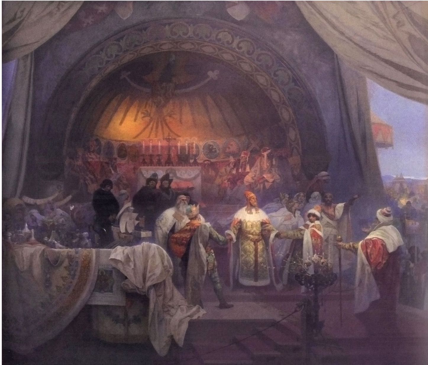
5. Le Roi Premysl Ottokar II de Bohême (XIII e siècle) L'union des dynasties slaves