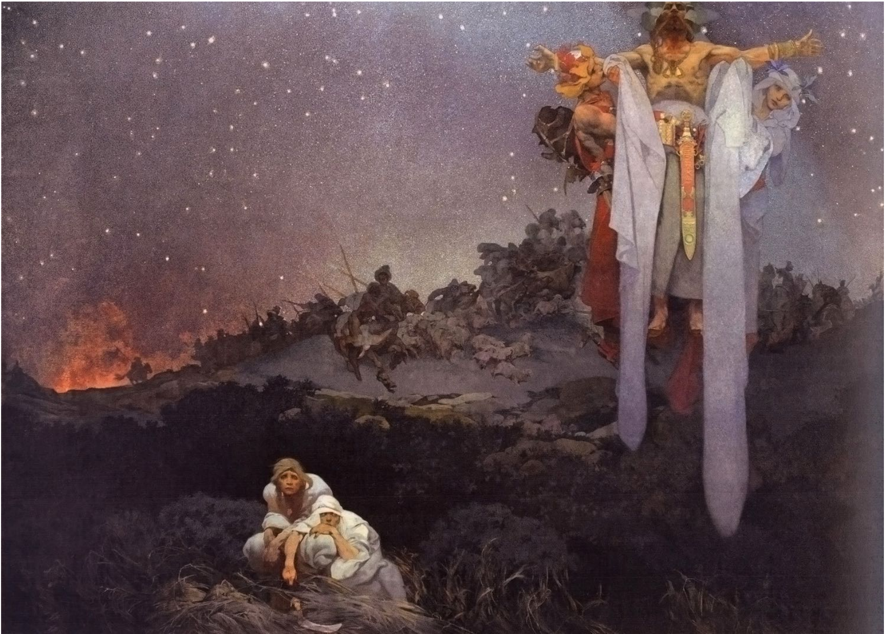
1. Les Slaves dans leur site préhistorique (III e siècle) Entre le knout touranien et le glaive des Goths